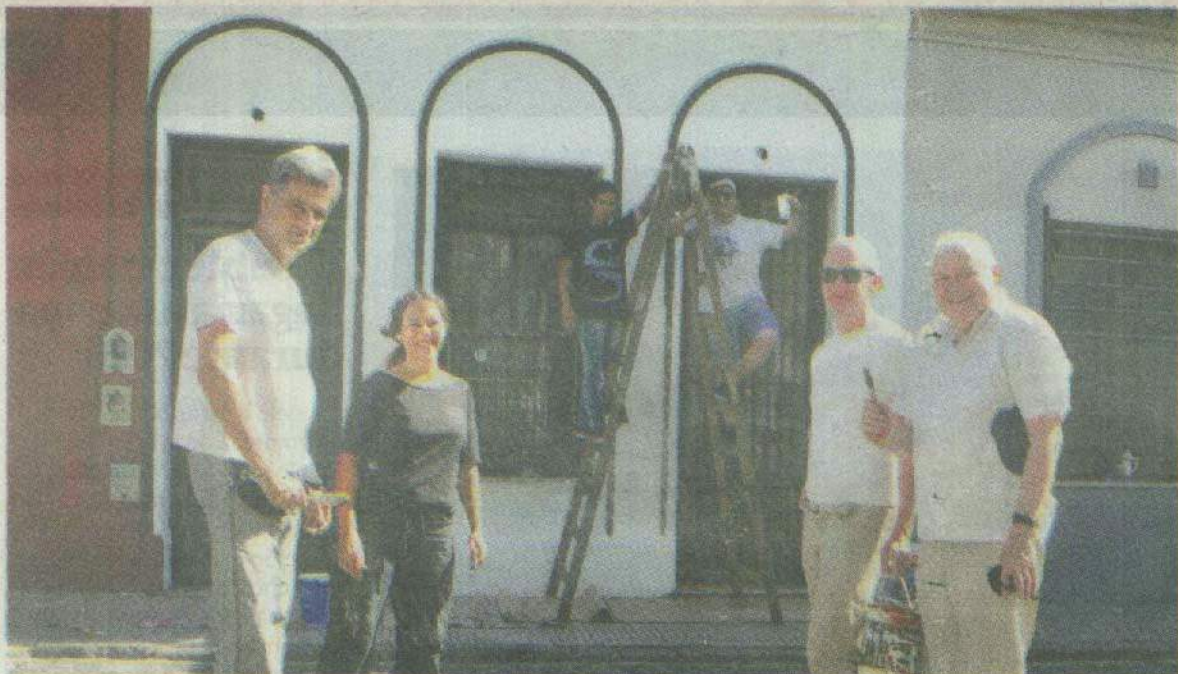
En acción. Woods y parte de la gente que se juntó en Estados Unidos al 500 a trabajar y celebrar. GUSTAVO ORTIZ

Movida en el barrio Ya trabajaron sobre las calles Chacabuco y Estados Unidos