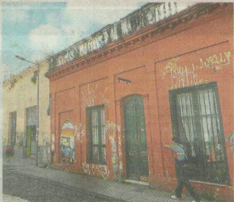
Antes. Estados Unidos al 500, con pintadas y yuyos.